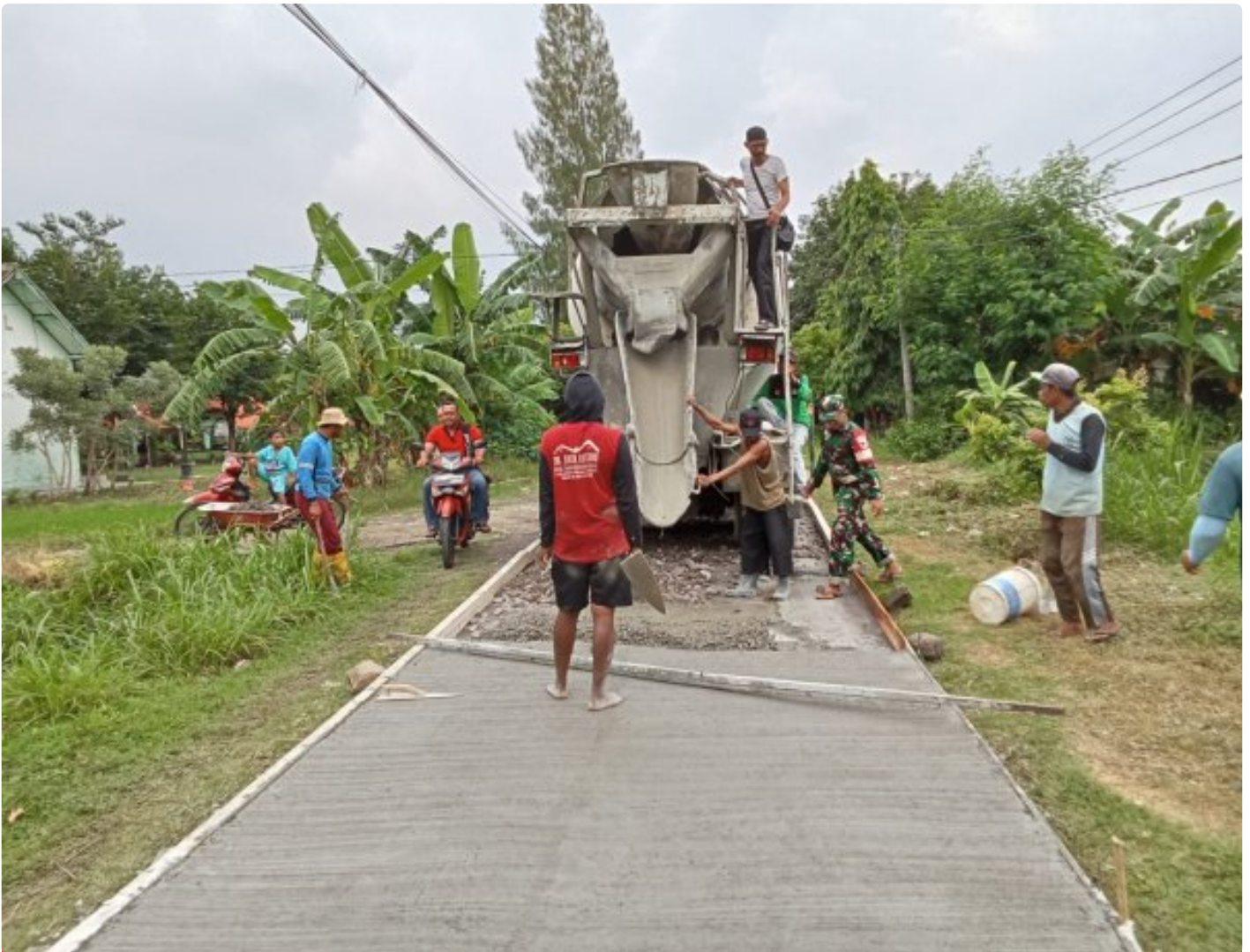
Membangun Desa Bersama Warga, Prajurit Kodim 0804/Magetan Tingkatkan Kemanunggalan Dengan Rakyat

Magetan. - Selalu dekat dengan rakyat dan selalu dihati rakyat, merupakan salah satu kunci utama keberhasilan TNI AD yang menganut sistem ketahanan rakyat semesta yang mana dengan kebersamaan antara TNI dan rakyat itu akan